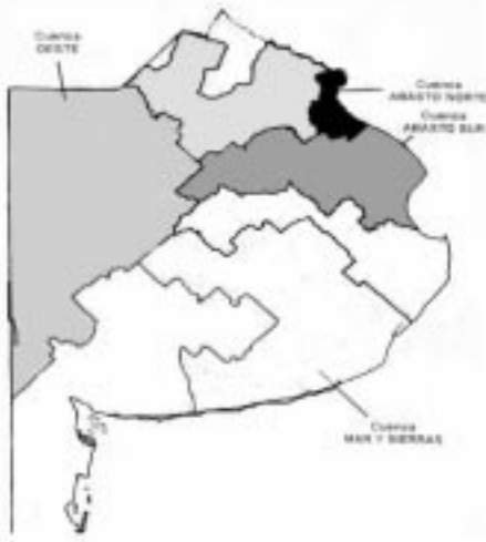
Figura 1: Cuencas lecheras de mayor importancia en la Provincia de Buenos Aires (SAGPyA, 1996)

el consumo de agua que se utiliza para el lavado de la máquina de ordeño y del tanque de almacenamiento de leche se estableció a partir de los consumos reales en cada tambo. Este valor fue informado por cada uno de los tamberos entrevistados.